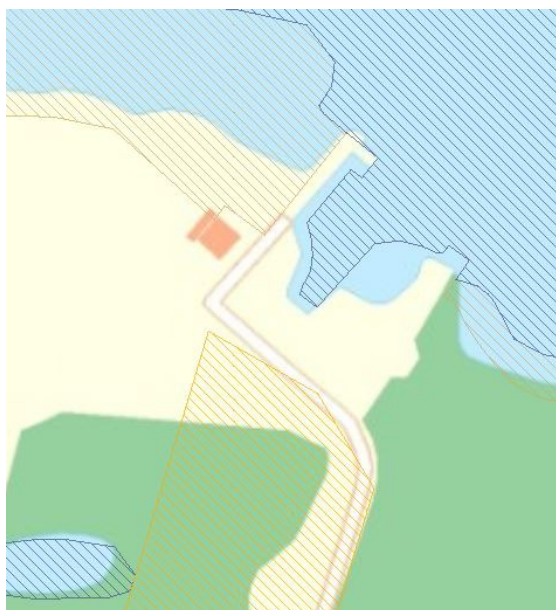
Beskyttet naturtype "overdrev" (gult)