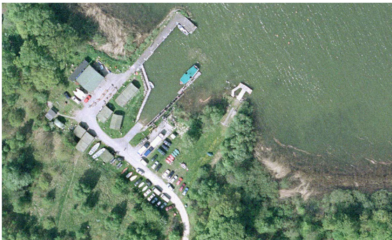
Eksempel på luftfoto 2002

Endelig er der indhentet oplysninger om bådpladser i Ramløse Havn mv. fra "Arresø Sejlklubs" hjemmeside og Naturstyrelsen, og Naturcenter Auderød Havn har bidraget med oplysninger.