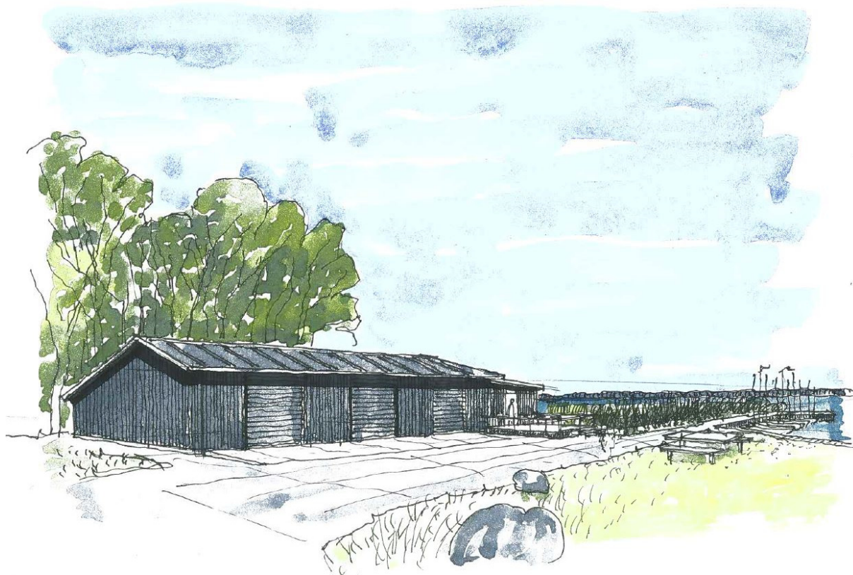
Naturcenter Auderød Havns bådahal og klubhus